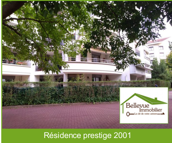
Résidence prestige 2001

Référence 26290 Dans une résidence de qualité de 2001, appartement de bon confort dans un environnement calme et verdoyant, de 88m 2 avec 21 m 2 d'extérieur une grande terrasse, 2 balcons et un garage.